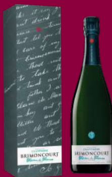
BLANC DE BLANCS